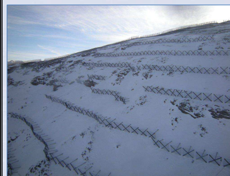
Seggiovìa "Colò" job: vista d'insieme