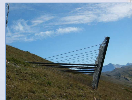
Ski area "Cresta": dettaglio filare elementi "VELA-Fermaneve"