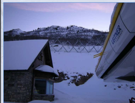
Intervento 2009/2010: vista d'insieme