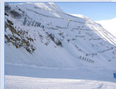
Intervento 2006: vista d'insieme