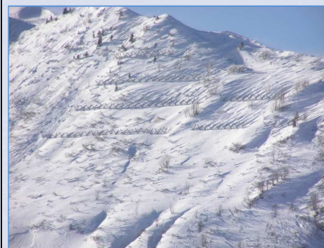
Intervento 2005: vista d'insieme