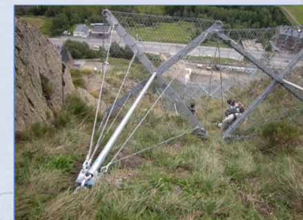
Dettaglio elemento "VELA-Fermaneve"