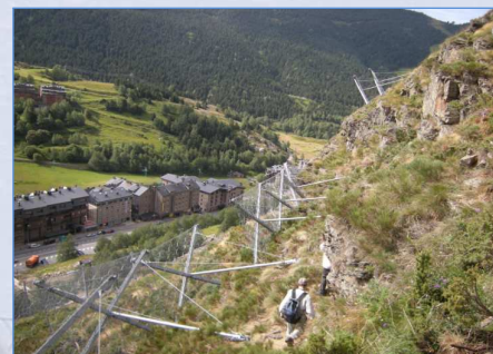
Dettaglio filare "VELA-Fermaneve"