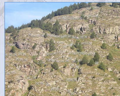
Vista d'insieme dell'intervento