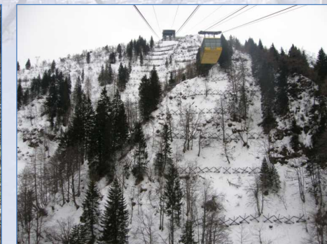
Vista d'insieme da valle dopo la nevicata