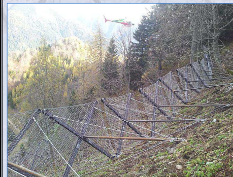
Dettaglio filare "VELA-Fermaneve"